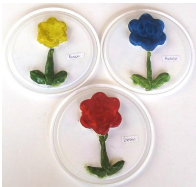
«Цветочек» (март) (плоскостной)