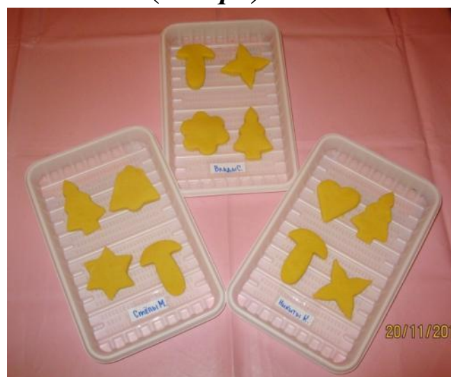
«Вкусное печенье» (плоскостное) (ноябрь)